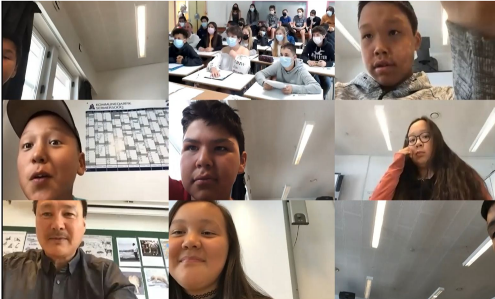
Visio avec l'école d'Ittoqqortoormiit

Nous avons découvert le mode de vie des Inuit du Groenland, l'histoire du commandant Charcot qui a exploré le Scoresby fjord et étudié les milieux polaires grâce à l'équipe Greenlandia et aux scientifiques. Nous avons communiqué avec les élèves d'Ittoqqortoormiit, par visioconférences et nous continuerons d'échanger par mail et les réseaux sociaux.