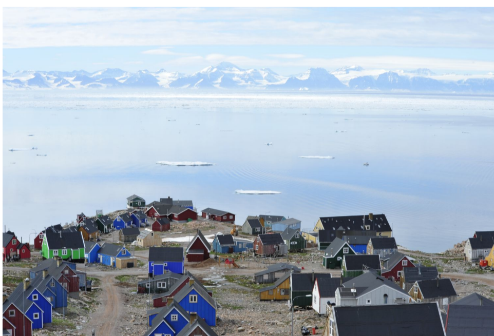
Le village d'ittoqqortoormiit et le Scoresby fjord

Cette initiative est assortie d'actions pédagogiques, scientifiques et documentaires, parmi lesquelles un certain nombre d'expéditions dans le Scoresby fjord (Groenland) jusqu'en 2025.