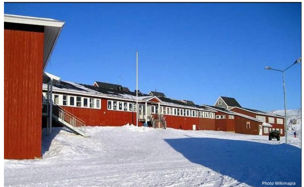
École d'Ittoqqortoormiit au Groenland

Cependant, le tiraillement entre l'envie de rester et le désir de partir reste présent.