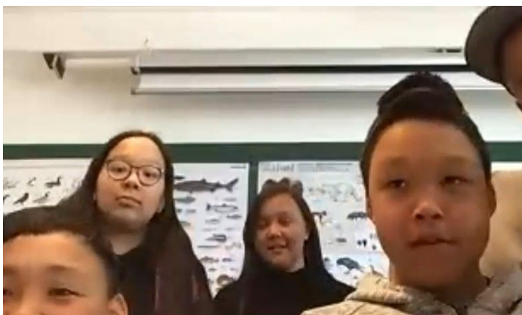
Nos correspondants d'Ittoqqortoormiit

Nous avons tout d'abord écouté les présentations des Inuit avant que nos représentants présentent les groupes d'élèves. Ensuite nous leur avons posé des questions sur leur vie au quotidien et ils nous ont expliqué qu'ils ne pouvaient pas avoir les mêmes animaux domestiques que nous (chien, chat, hamster...) à cause du froid. Nous avons tout de même beaucoup de points communs : même en étant si éloignés, nous partageons par exemple la même passion autour du football, admirons les mêmes joueurs et nous empressons d'y aller après l'école.