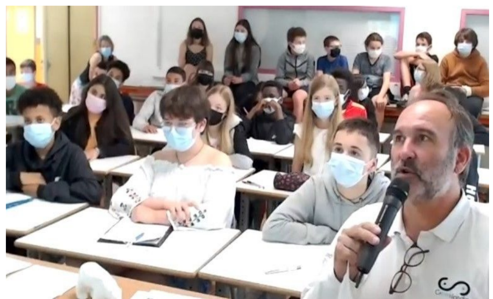
Les élèves de Chartres de Bretagne