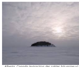
Alberta, Canada (extraction des sables bitumineux)

Au carré d'Art, les 4D ont découvert l'exposition de photographies prises par Samuel Bollendorff sur les Contaminations ou pollutions industrielles qui souillent notre planète Terre.