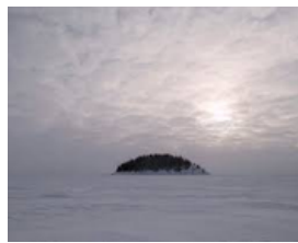
Alberta, Canada. Extraction of bituminous sand)

In the Carré d'Art Center, the pupils of 4D have discovered the exhibition of photographs taken by Samuel Bollendorff on the contaminations and industrial pollutions that dirty our planet.