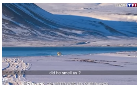
Living with the polar bears