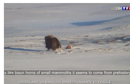
La banquise impressionnante et fragile