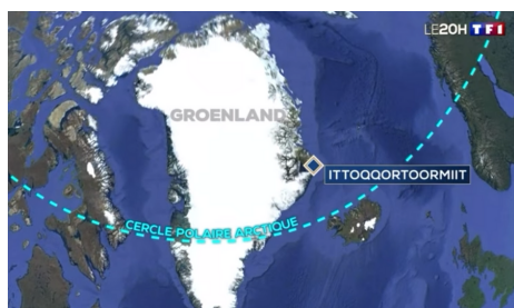
Le Groenland en danger

Une belle série de trois reportages réalisés par Michel Izard et Bertrand Lachat et diffusés en pleine COP 26, à découvrir ci-dessous.