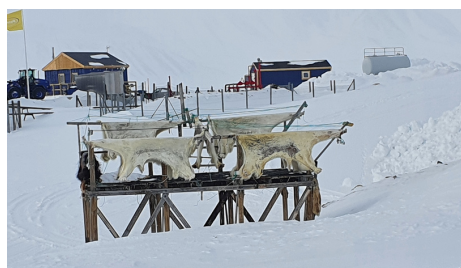
Des peaux d'ours

Le 1er est parti faire des prélèvements d'eau dans la banquise afin de faire des analyses de plancton.